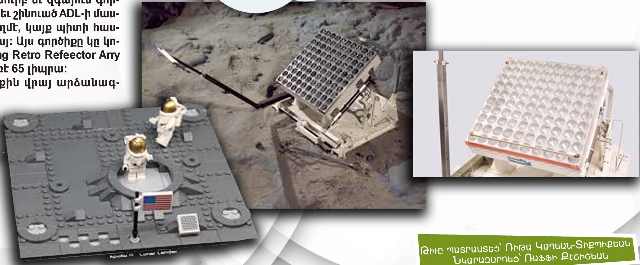
ԹԻՒԸ ՊԱՏՐԱՍՏԵՑ՝ ՈՒՐԱ ԿԱՐԵԱՆ-ՏԻՔՄԻՔԵԱՆ ՆԿԱՐԱԶԱՐՈՒՄԵՑ՝ ՈԱՅՖԻ ՔԵՇՈՒՄԵԱՆ

Յիշեալ գործիքին վրայ արձանագրուած են տասը անուններ՝ մասնաւոր մետաղեայ պիտակներով, որոնցմէ մէկը հալէպահայ ՀՍԸՄ-ի սկաուտ ընդհանուր խմբապետ եղբ. Լեւոն Պապլուզեանն է: